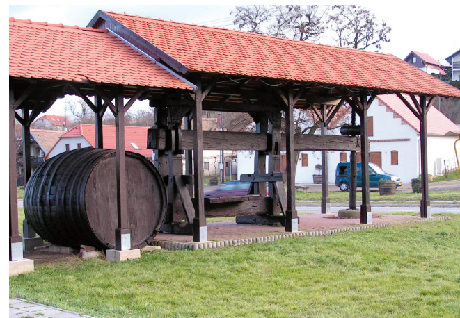
Nový Šaldorf – kládový lis