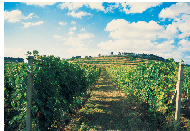
Miroslav – viniční trať Weinperky