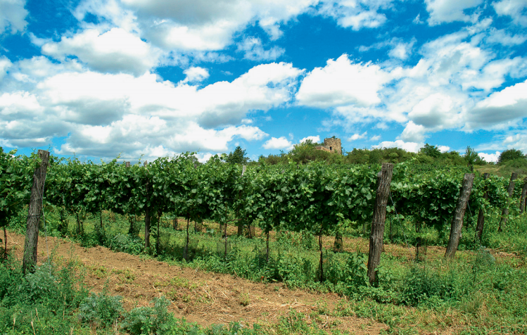
Vrbovec – viniční trať Lampelberg