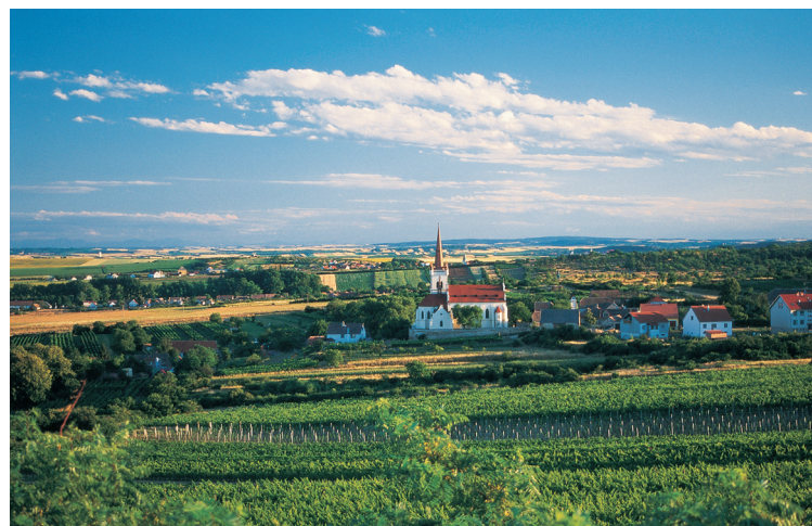
Znojmo-Konice – viniční trať Kraví hora