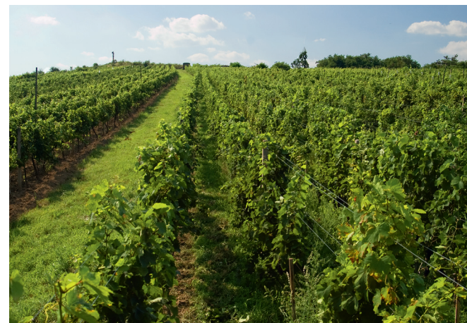
Bohutice – viniční trať U sv. Michala