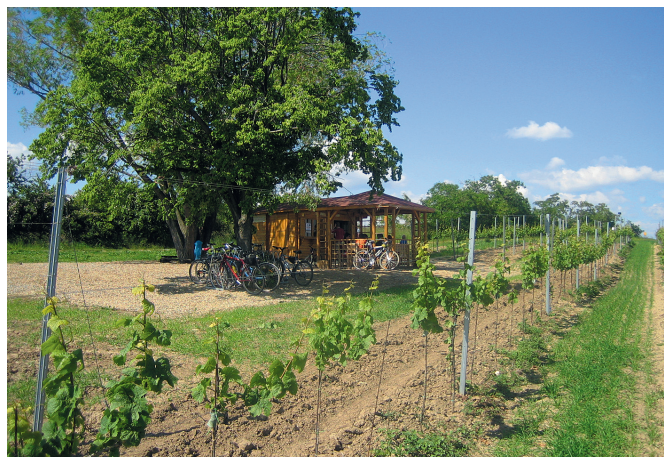
Havraníky – viniční trať Staré vinice