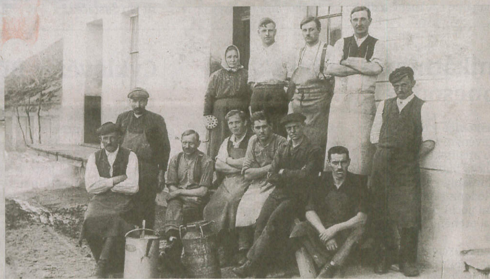
MLÉKAŘI. Zaměstnanci malé mlékárny Haase a Nenadala v hodonické Školní ulici v roce 1922.