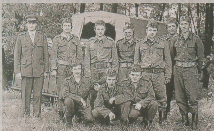
HASIČI. Sbor dobrovolných hasičů v Hodonicích v sestavě z počátku osmdesátých let.