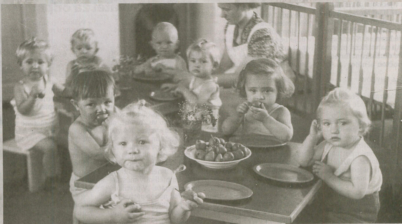
CHUTNÁ. Hodoničtí nejmenší v místních jeslích při svačině v padesátých letech.

HODONICE jsou obec ležící devět kilometrů východně od Znojma. Historické prameny ji poprvé zmiňují k roku 1281, kdy byl farní patronát věnován Řádu křížových rytířů s červenou hvězdou v Praze. Četné archeologické nálezy, však dokládají osídlení od starší doby kamenné. Obyvatelé se již od počátku zabývali především polním hospodářstvím a vinařstvím, což dokládá stará obecní pečeť s pluhem a vinařským nožem. Roku 1348 část majetku v Hodonicích koupil klášter klarišek ze Znojma. Obec značně trpěla v období francouzských válek. Během bitvy u Znojma zde v roce 1809 přenocoval císař Napoleon. Množství vydatných pramenů pitné vody umožnilo založení několika mlýnů i pivovaru se sladovnou. Později zde vznikly i konzervárny, mlékárny či lihovar. Hodonice zůstávají také vinařskou obcí. Hodonice jsou sedmadvacátou obcí, kterou v seriálu představujeme.