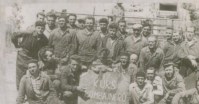
ZA LEPŠÍ ŽNĚ. Kombajnéri na kursu v roce 1962.