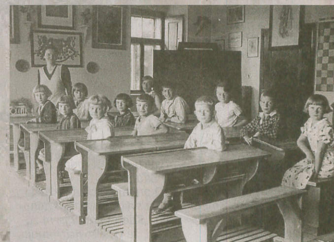
ČESKÁ ŠKOLA. Menšinová česká škola sídlila v Hodonicích v bývalém statku v ulici U kostela. Na snímku žáci z roku 1933.