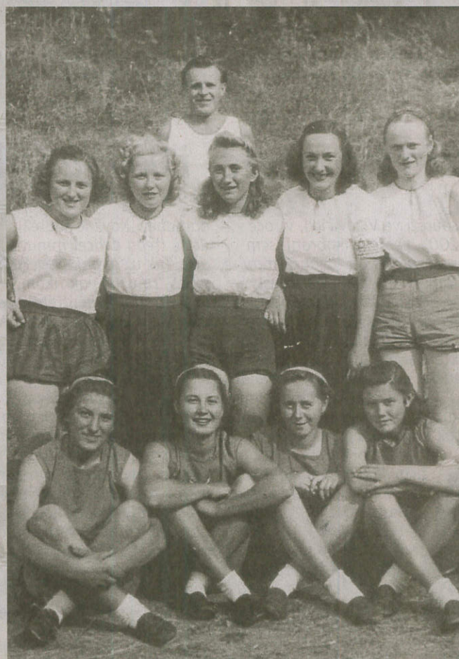
CVIČENÍ. K aktivním spolkům v Hodonicích patřil Sokol. Jeho jméno nese i dnešní TJ.