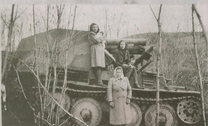
POVÁLCE. Zbytky německé válečné techniky si chodily prohlížet i hodonické ženy.