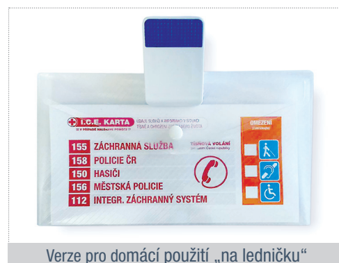
Verze pro domácí použití „na ledničku“

Byla spoluvyvořena projektem Senioři v krajích Ministerstva práce a sociálních věcí ČR a Jihomoravským krajem, především s tamní zdravotnickou záchrannou službou (ZZS) a dalšími složkami IZS v červnu 2018, jako výstup kulatého stolu Stárneme ve zdraví. Díky projektu Senioři v krajích je distribuována po celé ČR. Na základě zpětné vazby na „domácí“ verzi nyní vznikla také MINI „cestovní“ varianta do peněženky.