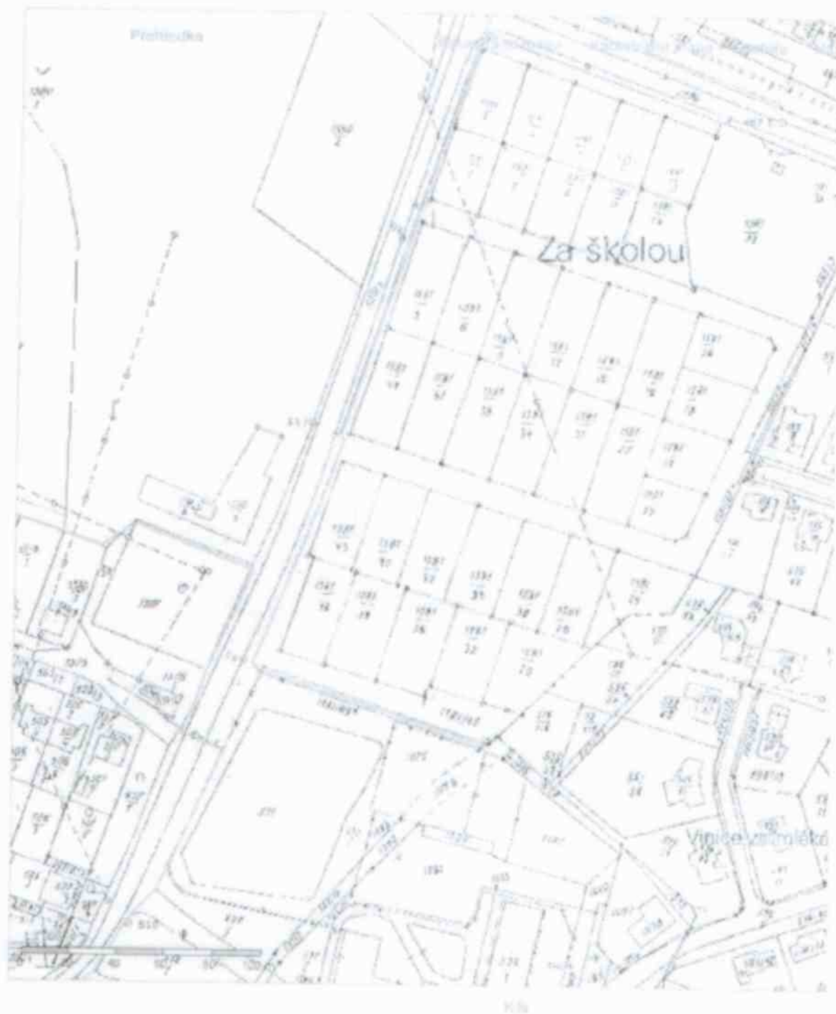
Situace 1: 1000