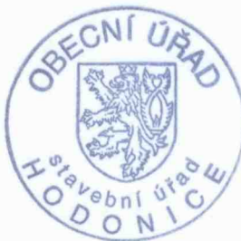
Jan Stavinoha vedoucí stavebního úřadu

Toto územní rozhodnutí platí 2 roky ode dne, kdy nabude právní moci . Územní rozhodnutí pozbude platnost, nebude-li ve lhůtě platnosti podána úplná žádost o stavební povolení, ohlášení nebo jiné opatření podle stavebního zákona nebo zvláštních právních předpisů, nebude-li započato s provedením stavby, nebo bude-li stavební nebo jiné povoloovací řízení zastaveno, nebo bude-li podaná žádost zamítnuta po lhůtě platnosti územního rozhodnutí.