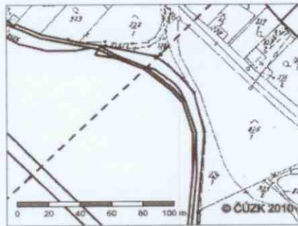
Zobrazení v grafickém prohlížeči

Parcelní číslo: 3170 Obec: Hodonice [594067]# Katastrální území: Hodonice [640395]# Číslo LV: 10002 Výměra [m 2 ]: 159 Typ parcely: Parcela katastru nemovitostí Mapový list: DKM Určení výměry: Ze souřadnic v S-JTSK Druh pozemku: orná půda