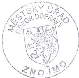
Bc. Ivana ZÍTKOVÁ vedoucí oddělení silničního hospodářství a silniční dopravy odboru dopravy

S návrhem se lze seznámit ve lhůtě do 30 dnů od jeho zveřejnění u Městského úřadu Znojmo, odboru dopravy, nám. Armády 1213/8, IV. nadzemní podlaží, dveře č. 438, vždy v úřední dny (pondělí a středa od 08.00 hod. do 17.00 hod.) tak, jak je uvedeno ve Výzvě k podání připomínek nebo námitek, která je přílohou tohoto návrhu.