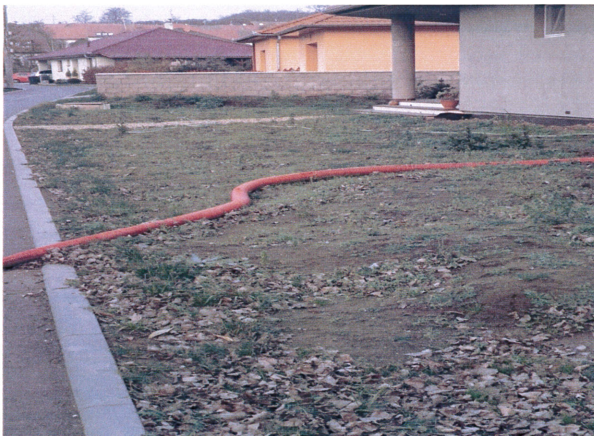
Obrázek 6 Prodělalovi - před garáží