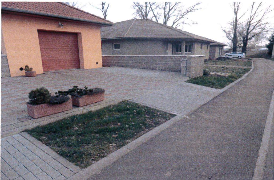
Obrázek 3 Kubíkovi - před garáží