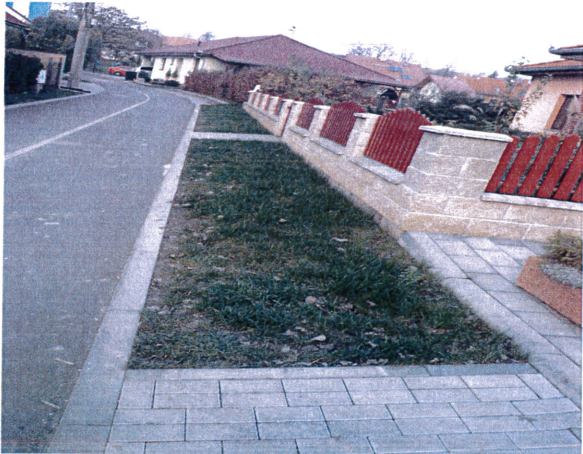
Obrázek 2 Kubíkovi - před domem