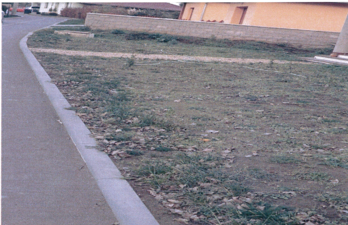
Obrázek 5 Prodělalovi - před domem