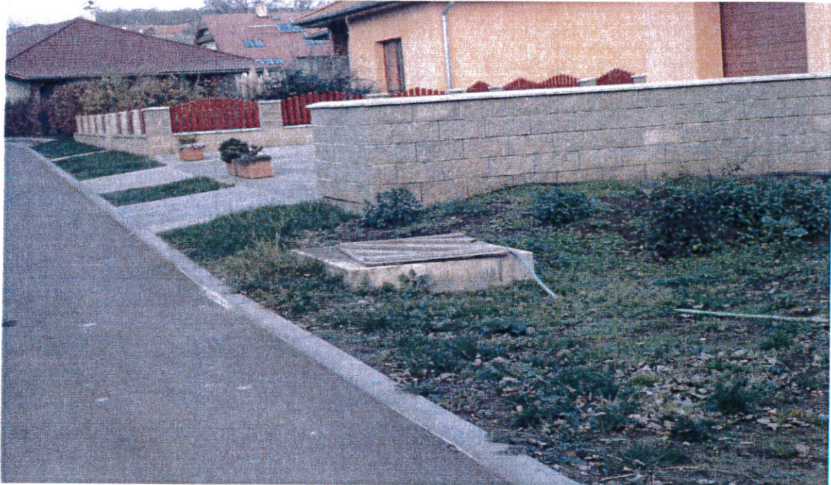
Obrázek 1 Kubíkovi - celkový pohled