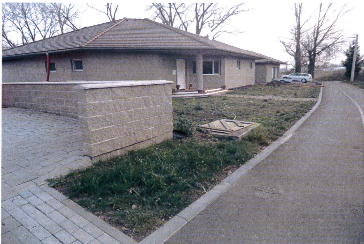
Obrázek 4 Prodělalovi - celkový pohled