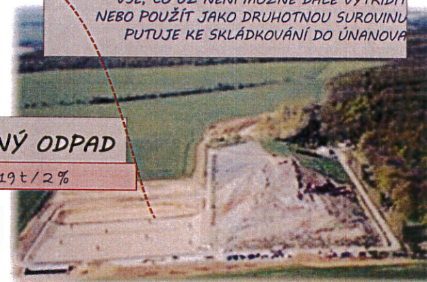
Směsný komunální odpad - vývoj

VŠE, CO UŽ NENÍ MOŽNÉ DÁLE VYTRÍDIT NEBO POUŽÍT JAKO DRUHOTNOU SUROVINU PUTUJE KE SKLÁDKOVÁNÍ DO ÚNANOVA