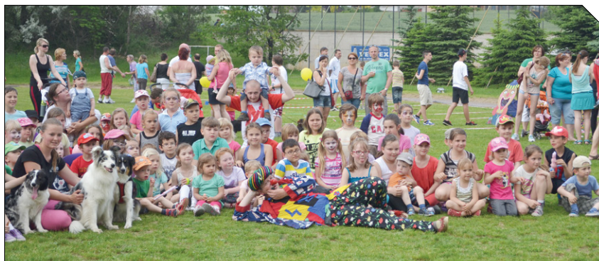
V sobotu 24. května uspořádalo občanské sdružení Hodoňáci, o.s. na školním hřišti v Tasovicích Velký dětský den.

Další fotografie si můžete prohlédnout ve fotogalerii Františka Šimíka.