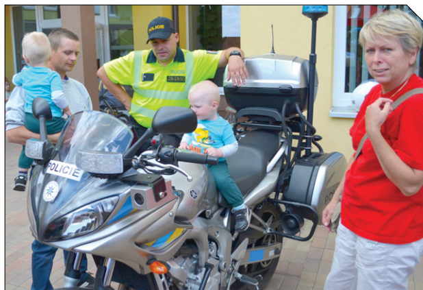
V sobotu 14. června uspořádalo občanské sdružení Za Hodonice krásnější, o.s. Dětské odpoledne. A bylo veselo a všem se líbilo.