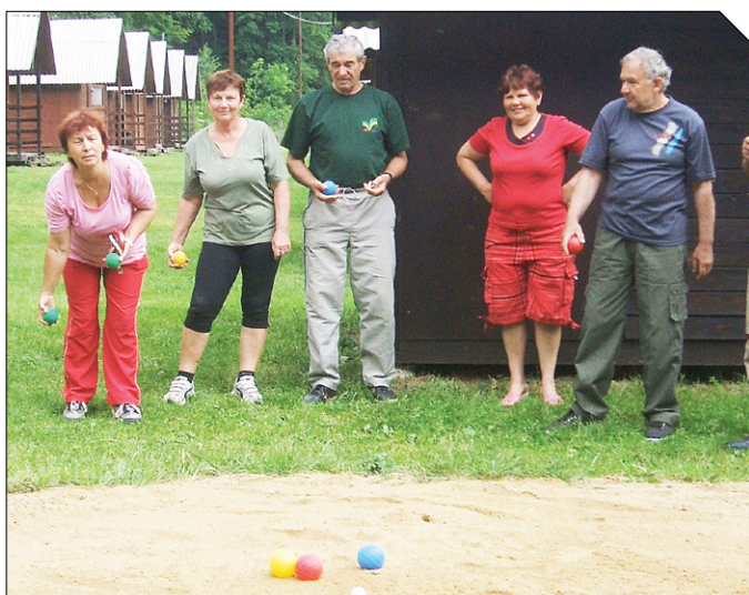
Léto přivítali turnajem v petanque, který proběhl na TZ v Bojanovicích. Jako důkaz přikládáme fotografie.