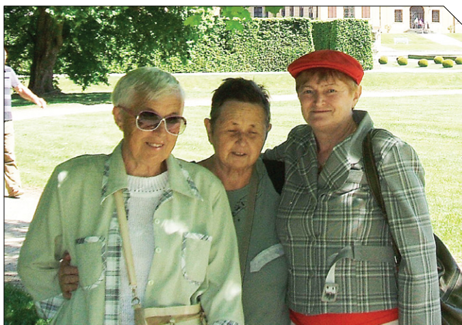
Hodonický klub seniorů Podjízí je znám svou pestrou činností. Jako poslední uskutečnili naši senioři výlet na zámek v Jaroměřicích nad Rokytnou a do Jevišovic.