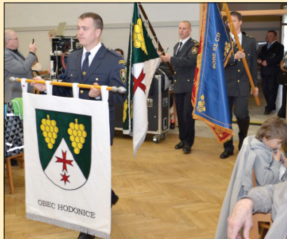
Dobrovolní hasiči přinášejí obecní znak, obecní a hasičský prapor.