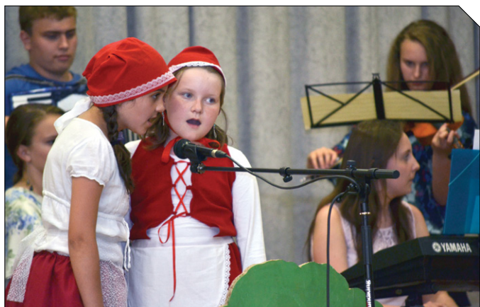
V pátek 6. června uspořádala ZŠ Tasovice v Kulturním domě v Hodonicích Školní akademii. Krásné foto najdete fotogalerii Františka Šimíka.