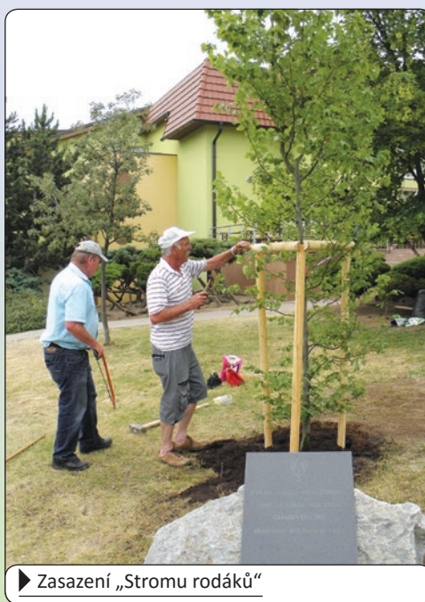
► Zasazení „Stromu rodáků“