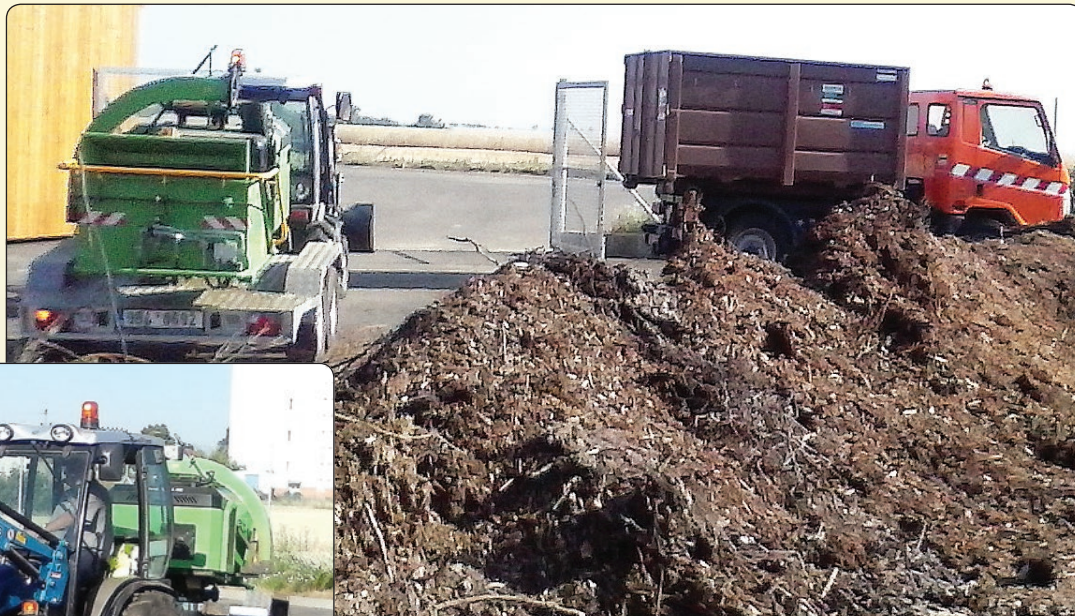
► Komunální technika pro obsluhu kompostárny a péči o plochy zeleně

Další novinkou je odkaz na www.hodonice.cz/zivotni-prostredi . Zde naleznete kompletní informace o nakládání s odpady a dále o podmínkách kácení dřevin, rostoucích mimo les. Připomínáme, že i v této oblasti došlo ke změnám, vyhláška z roku 2013 byla změněna novou vyhláškou č. 222/2014 Sb., účinnou od 1.11.2014.