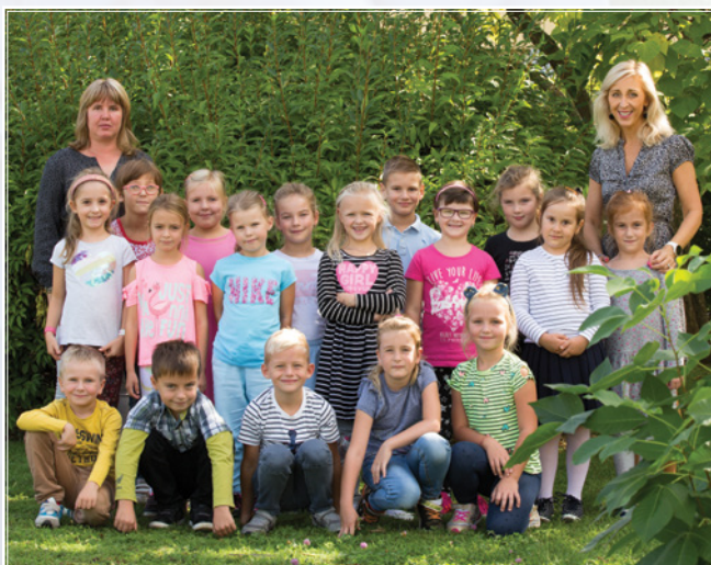
Třída 1. A.

Letošní první školní den připadl na pondělí druhého září. Spoustu dětí plných nadšení a očekávání přišlo do sálu kulturního domu v Hodonicích, kde je spolu se svými rodiči čekalo milé, až dojemné přivítání se základní školou. Nápomocní byli žáci devátého ročníku, kteří se zodpovědně, a také již s nadhledem zkušených školáků, ujali svých malých kamarádů, aby je dovedli do své školy. Děti v tyto první školní okamžiky poznaly také svoji paní učitelku, která jim bude vzorem a oporou a bude je učit tolik nového. Bezesporu všechny děti se těšily, napjaté, co nástup do první třídy obnáší. Počáteční rozpaky jsou v tuto chvíli už běžnou rutinou. Tak přejeme dětem, aby se jim ve škole líbilo, aby se jim dařilo a vše ve škole fungovalo dle jejich představ.