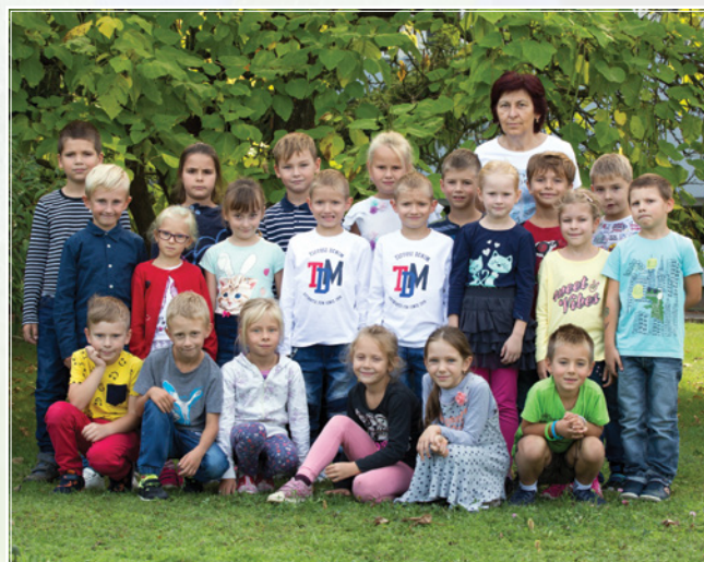
Třída 1. B.